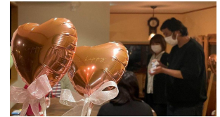
町内のイベントのお手伝いで、 ボードゲームを教えてくださいました。

「全国旅行支援～やまがた旅割キャンペーン」が 令和4年12月27日(火)まで期間延長されました。 また、「朝日町宿泊応援キャンペーン」も、 令和5年3月12日(日)まで延長になりました。 ご利用の際は、ぜひご利用下さい。